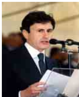
Ministro Giovanni Alemanno

Contro la tassazione delle rendite i poteri finanziari hanno scatenato una disinformazione mediatica atta al mantenimento dello status quo . L'argomento invece merita un approfondimento perché soprattutto oggi, in tempi di finanziaria, è necessario considerare che un eventuale aumento della tassazione sulle rendite finanziarie, che sono oggi al 12.5%, le più basse d'Europa, consentirebbe di recuperare tra 2,7 e 3 miliardi di euro utili per tagliare le tasse sul lavoro, attualmente al 23%, la più alta in Europa, con l'obiettivo finale di alleggerire la pressione fiscale complessiva. Iniziamo con il precisare quindi che, come più volte ripetuto dal ministro Gianni Alemanno, nessuno pensa di aggravare la tassazione sui Bot e i Cct e di gravare così sui piccoli risparmi delle fa-